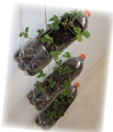
Le potager en bouteille