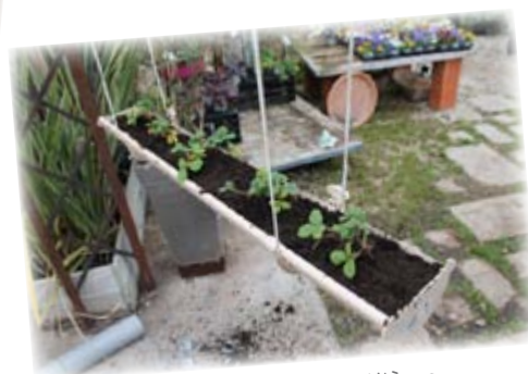
Le potager sur gouttières

Des fiches techniques détaillant le matériel nécessaire et les étapes de constructions des supports verticaux seront fournies aux établissements sélectionnés.