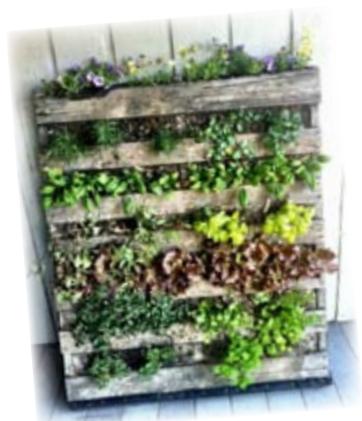
Le potager sur palette

Voici quelques exemples que nous avons testés :